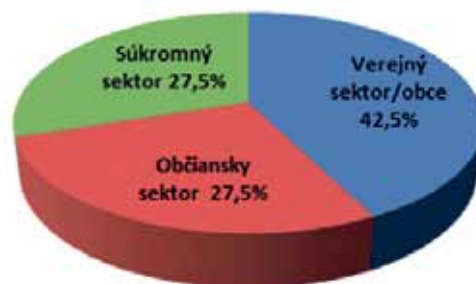
% podiel členov MAS