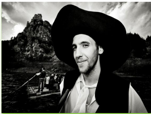
Pltníci na Váhu

Schválené MAS SR mali možnosť prihlásiť sa už do 2. ročníka súťaže Najkrajšia fotografia z územia MAS. Naše združenie sa prihlásilo do všetkých 6 kategórií. Hlasovanie prebiehalo od 15.6. do 31.7.2012 na stránke www.nsrv.sk . Slávnostné vyhlásenie výsledkov súťaže sa uskutočnilo počas Vidieckeho večera. Naše združenie získalo v kategórií "Naše Naj" 3. miesto s fotografiou Pltníci na Váhu, ktorej autorom je pán Martin Šmehýl. Touto formou mu vyjadrujeme úprimné poďakovanie za poskytnutú fotografiu a zároveň sa pripájame ku gratulácií za pekné umiestnenie v súťaži.