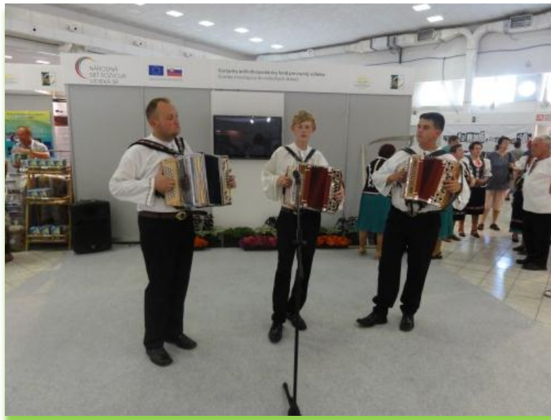
Heligonkári z Krasnian

Schválené MAS SR mali možnosť prihlásiť sa už do 2. ročníka súťaže Najkrajšia fotografia z územia MAS. Naše združenie sa prihlásilo do všetkých 6 kategórií. Hlasovanie prebiehalo od 15.6. do 31.7.2012 na stránke www.nsrv.sk . Slávnostné vyhlásenie výsledkov súťaže sa uskutočnilo počas Vidieckeho večera. Naše združenie získalo v kategórií "Naše Naj" 3. miesto s fotografiou Pltníci na Váhu, ktorej autorom je pán Martin Šmehýl. Touto formou mu vyjadrujeme úprimné poďakovanie za poskytnutú fotografiu a zároveň sa pripájame ku gratulácií za pekné umiestnenie v súťaži.